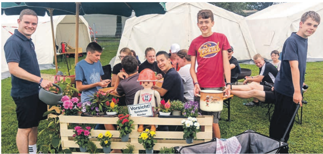
Die Jugendwehr als Münster und Altheim schmückte ihren Bereich mit Gartenelementen besonders eindrucksvoll. Neben Blumen war sogar Biergartenkies angedacht, der aus Schutzgründen des Rasens aber nicht zugelassen wurde. Der Landrat machte trotzdem ein Foto und freute sich über das heimelige Ambiente.

Münster den Kreisjugendfeuerwehrtag. Das Camp am ersten Ferienwochenende sei bei ihm fest eingeloggt. Mit den Eltern geht es für ihn in den nächsten Tagen noch zum Arlberg und nach Potsdam. Und wie stressig ist das Zeltlager für die Betreuer? „Natürlich muss man einiges wiederholen, bis es von den Kids verstanden wird. Dennoch ist der Feuerwehrtag insgesamt pflegeleicht“, so der allgemeine Tenor. Die Nachtruhe werde um 23 Uhr eingeläutet, um Mitternacht sei dann wirklich bei allen Schluss. Zum Erreichen der Leistungsspange traten 13 Jugendwehren an. Die Spange ist kein Wettkampf, sondern eine Leistungsabnahme. Die Gruppen umfassen neun Personen, alle sind mindestens 15 Jahre alt. Die fünf Disziplinen enthalten eine Mischung aus Sport und Feuerwehrtechnik. Ein Staffellauf und Kugelstoßen gehören ebenso dazu wie ein Löschangriff, bei dem es etwa um Schnelligkeit beim Schläucheverlegen geht. Sogar ein theoretischer Teil ist Bestandteil mit der einen oder anderen Frage aus der Politik. „Wir sind ein Jugendverband und haben dementsprechend einen Bildungsauftrag. Deshalb spielen Werte aus unserer demokratischen Grundordnung ebenfalls eine Rolle“, gibt Kreisjugendfeuerwehrtag Sören Grundmann zu verstehen. Am frühen Samstagabend wurden die Leistungsspangen in feierlichem Rahmen vergeben. Münster und Altheim traten in diesem Jahr nicht an, dafür aber Eppertshausen: Der Eppertshäuser Feuerwehrtag fehlte zwar beim Zelten, trug dafür aber die Leistungsspange erfolgreich nach Hause.