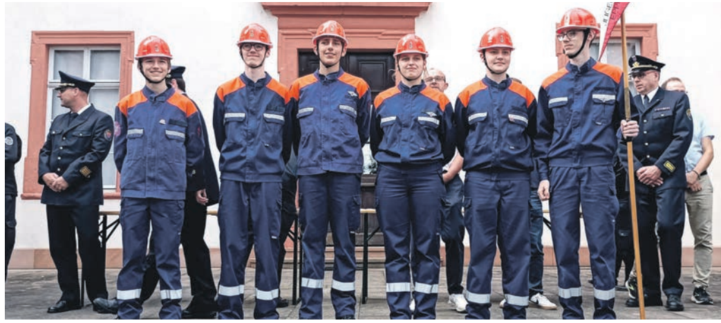
Die Jugendwehr aus Eppertshausen nahm zwar nicht am Zeltlager teil, dafür aber erfolgreich an der Leistungsspange.

Dieburg/Münster/Eppertshausen (micha) - „Wir wollen es ein bisschen gemütlicher haben. Nicht nur Zelte und eine Sitz-ecke“, sagt Frederick Frühwein, der stellvertretende Jugendfeuerwehrtag von Münster. Über das Ergebnis durfte gestaunt werden: Bei den Floriansjüngern aus Münster und Altheim stach eine kleine Palettenwand mit Blumen ins Auge, in die ein riesiger Playmobil-Feuerwehrmann saß. Rund 50 Euro hatte sich der 26-Jährige den Blumenschmuck, zu dem auch ein Kiwi-Bäumchen gehörte, kosten lassen. „Nach dem Wochenende geht das Grünzeug an meine Mutter“, kündigte Frühwein lachend an. Sein Einsatz hatte sich gelohnt: Selbst Landrat Klaus-Peter Schellhaas fiel auf seiner Runde durchs Camp die ungewöhnliche Verzierung auf, weshalb der Politiker sein Handy zückte und die Idee auf einem Foto festhielt. Rund 500 junge Blauröcke kamen von Freitag bis Sonntag beim diesjährigen Kreisjugendfeuerwehrtag in Dieburg zusammen. Neben den schönen Stunden im Zeltlager bestand am Samstag die Chance, das höchste Abzeichen der deutschen Jugendfeuerwehr, die Leistungsspange, zu erlangen. Dafür gings aus Platzgründen ins Münsterer Gersprenzstadion. Die Vorbereitungen für den Kreisjugendfeuerwehrtag liefen diesmal nicht wie gewünscht: „Haben wir sonst rund 1 000 Kinder- und Jugendliche im Alter von 10 bis 17 Jahren, kommen wir diesmal nur auf 500“, berichtete Kreisjugendfeuerwehrtag Sören Grundmann.